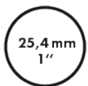
Diametro tubo principale 25,4mm