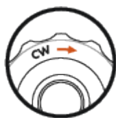
Direction de réglage CW