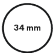
Diamètre du tube central 34mm